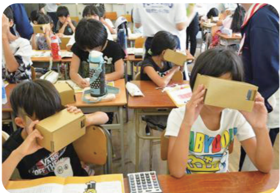
VR(バーチャルリアリティ)体験の様子