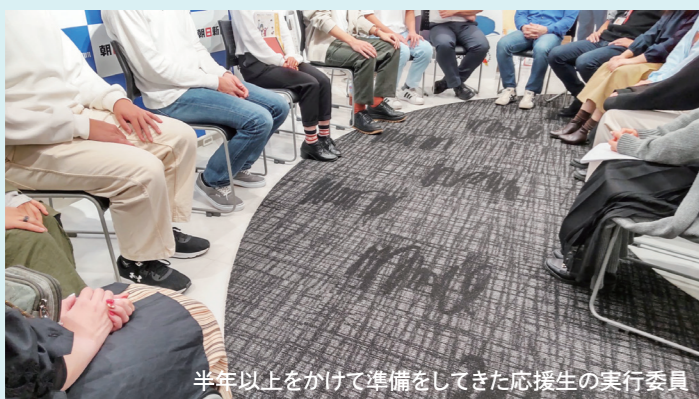
半年以上をかけて準備してきた応援生の実行委員

最大で5つのプログラムがオンラインで同時に進行し、さらにそれぞれ20分ごとに講師が変わるのは、事業団にとっても経験の無い開催形態でした。当日、実行委員の10人の応援生が朝日新聞東京本社ホールに集まり、配信基地を設置。初日の午前中、機器トラブルで準備していたグループワークができない事態が起こりました。混乱の中、乗り越えたのは、司会の応援生とサポートする仲間たちでした。半年前、メンバー間でのミーティングですら遠慮し、自信無く発言していた応援生が、夜遅くまでの打ち合わせやリハーサルなどを重ねて築いてきた突破力、胸を張って臨む姿は、私たちの予想をはるかに超えたものでした。