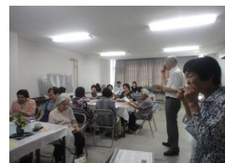
ハーモニカの伴奏で歌を 歌います