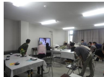
みんなで転倒予防体操