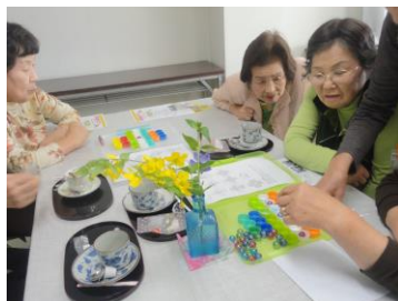
脳トレ「オンリーワン」