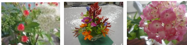
季節の花がきれいですよ。いろいろな花がありますね。