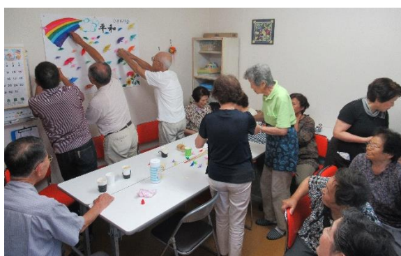
夏には折鶴を模造紙に貼り、平和を祈願！