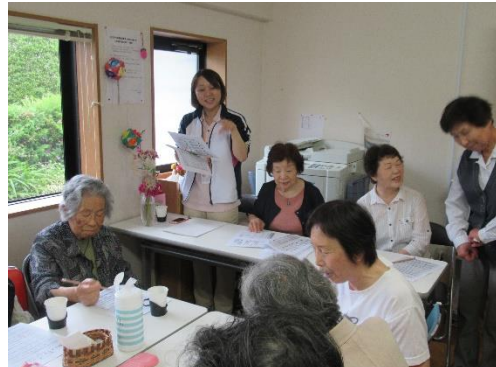
この日はケアマネさんが来て楽しくお話し！