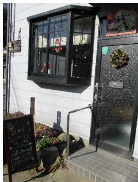
カフェ外観の様子