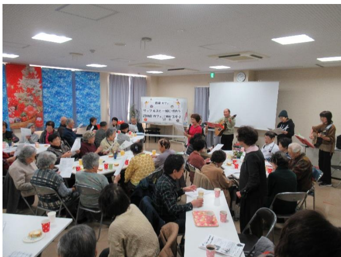
12月には場所を変えて2周年記念「音楽カフェ」。この時は隣町で活躍する「リップルズ」がボランティアで参加してくれました。