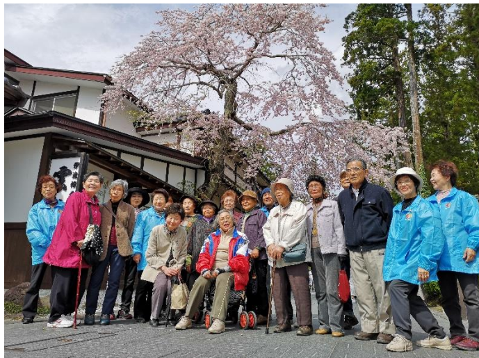
春はお花見「お散歩カフェ」瑞巖寺や円通院を通して「天隣院」へ秋の紅葉散策と合せ、みなさんと一緒に歩いています。