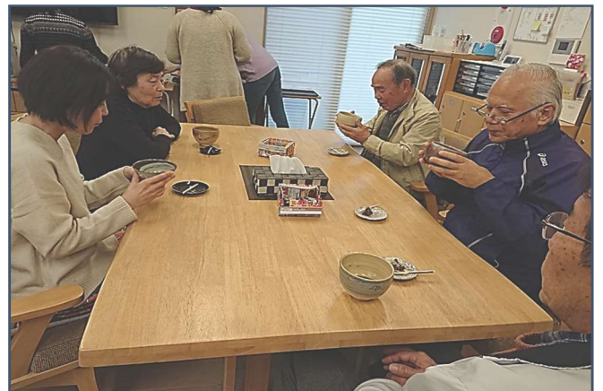
令和2年 カフェ渚園 初釜