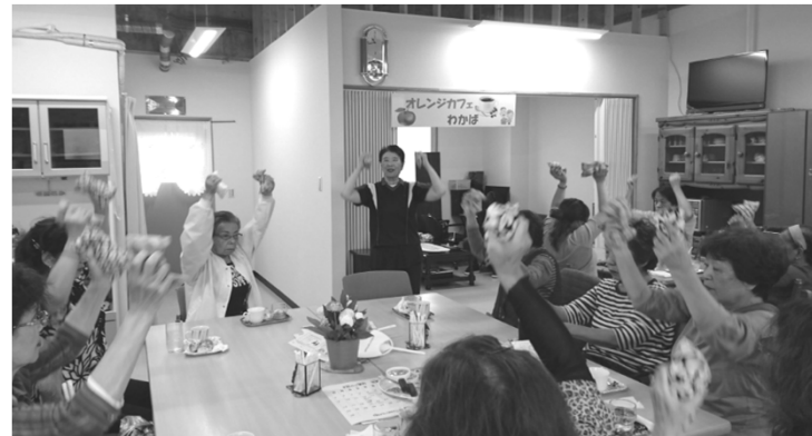
認知症・介護予防の体操を行いました。