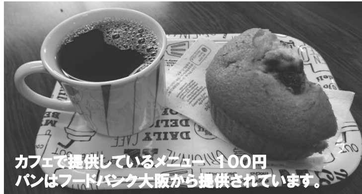
カフェで提供しているメニュー 100円 パンはフードバンク大阪から提供されています。

開催場所: 特定非営利活動法人 わかば会事務所 開催日: 毎月第2水曜日 参加者: 30名前後