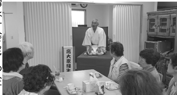
落語を聞いて大爆笑! リフレッシュしました。

カフェを理解し、一人でも多くの人に 参加してもらうために周辺地域にビラ まきをしました。